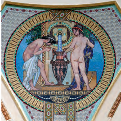
Auch in früheren Zeiten schätzte man das heilende Wasser.

Die ungarische Badekultur erblühte nach mehreren Kriegen und Revolutionen Ende des 19. und Anfang des 20. Jh.s. Jüdische Ärzte empfahlen die Heilwässer den Kranken als Trink- oder als Badekur und der Jugend als Leibesübung. Badepaläste entstanden, die an Kathedralen erinnern, darunter das Thermalfrei-