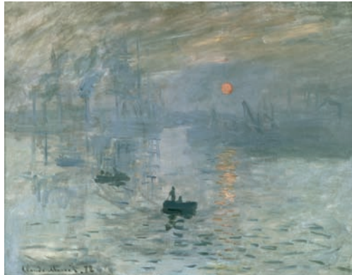
Gab dem Impressionismus den Namen: »Impression, soleil levant« von Monet

ebenso enthusiastisch schrieb Claude Monet von der Belle-Ile an seinen Malerfreund und Kunstsammler Gustave Caillebotte: »Ich befinde mich in einer wunderbar wilden Landschaft, inmitten von Felsen und einem unglaublichen Farbenmeer; ich bin voller Begeis-