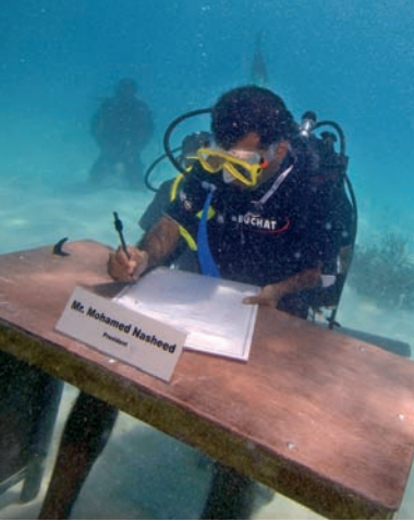
Spektakuläre Aktion: Das Kabinett der Malediven tagt auf dem Meeresboden.

genfälle die Hauptstadt Male‘ nicht überschwemmt wird. Ob das auf die Dauer hilft, kann durchaus bezweifelt werden. Denn die Klimaexperten sind sich einig: Die Auswirkungen des jahrhundertelangen Raubbaus an den natürlichen Ressourcen und wirtschaftliche Aktivitäten haben eine unaufhaltsam steigende Erderwärmung ausgelöst, die kaum mehr rückgängig zu machen ist. Der Klimawandel bewirkt nicht nur höhere Wassertemperaturen, sondern vor allem auch einen Anstieg des Meeresspiegels und eine Veränderung der Meeresströmungen. Und sollte der von Klimaforschern prognostizierte Meeres-