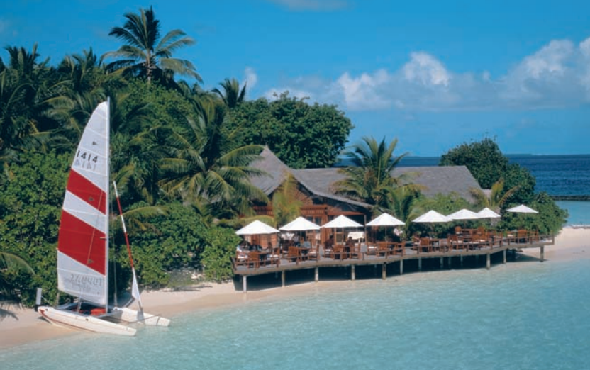
Urlaub wie im Bilderbuch: Eine Palmeninsel mit feinsandigem Strand, dazu behagliche Wohnhütten, ein Freiluft-Restaurant auf Stelzen und ein Katamaran

den Temperaturanstieg in den nächsten Jahren auf maximal ein Grad Celsius zu begrenzen. Man nahm es zur Kenntnis und stellte bedrohten Staaten wie den Malediven finanzielle Mittel in Aussicht, um die Folgen der globalen Erderwärmung zu lindern. Am Ende gab es eine rechtlich unverbindliche Absichtserklärung, den Ausstoß von Treibhausgasen zu reduzieren. Mehr nicht. Später brachte Nasheed noch eine durchaus ernst gemeinte Idee ins Gespräch: Land wolle er kaufen, auf das man im Falle der