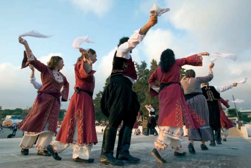
Folkloretanz bei den Osterspielen in der Nähe von Páfos